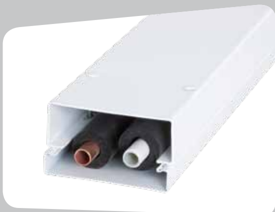
Element för anslutningsrör