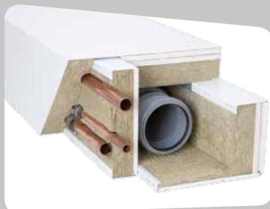
Kombinerat element för vatten- och avloppsrör