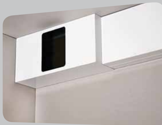
Vattenavläsning i varje lägenhet