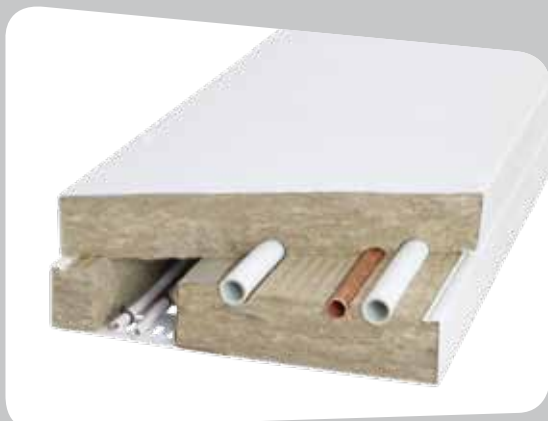
Kombinerat element för vattenrör samt el- och teleledningar