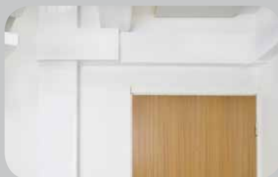
Vattenledningselement installerat i trappuppgång