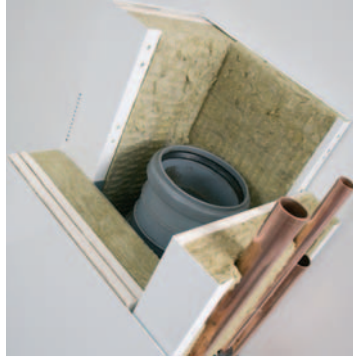
// YHDISTELMÄELEMENTIT VESI- JA VIEMÄRIPUTKILLE SEKÄ SÄHKÖJOHDOILLE